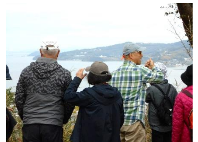
12/9,16「ヒロキさんと 山さるく」