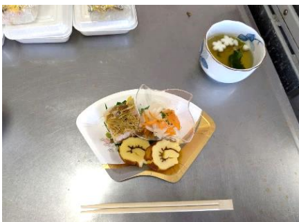
12/7 伊木力公民館 「大村寿司講座」