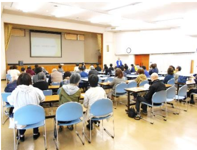
11/19「紫式部と源氏物語 の世界」