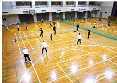
12/6,13,20「気軽にバウンドバス」