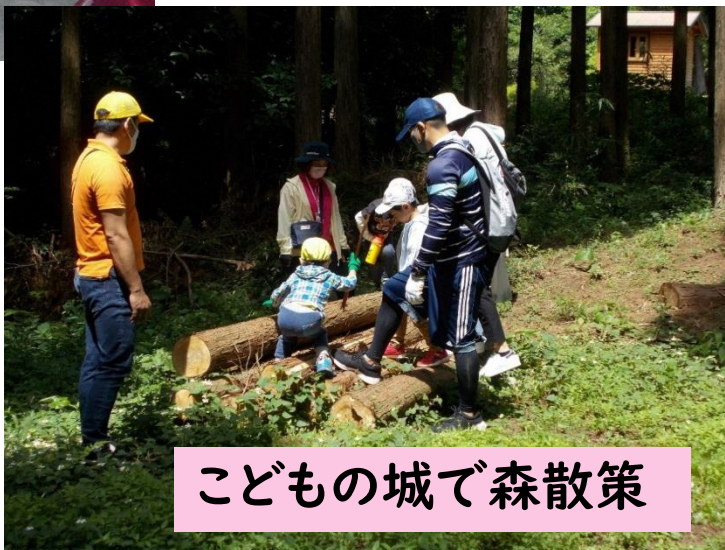
こどもの城で森散策