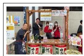
清酒 杵の川 鉄道グッズもあります！