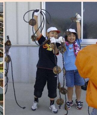
小学生によるカキ養殖体験学習の様子