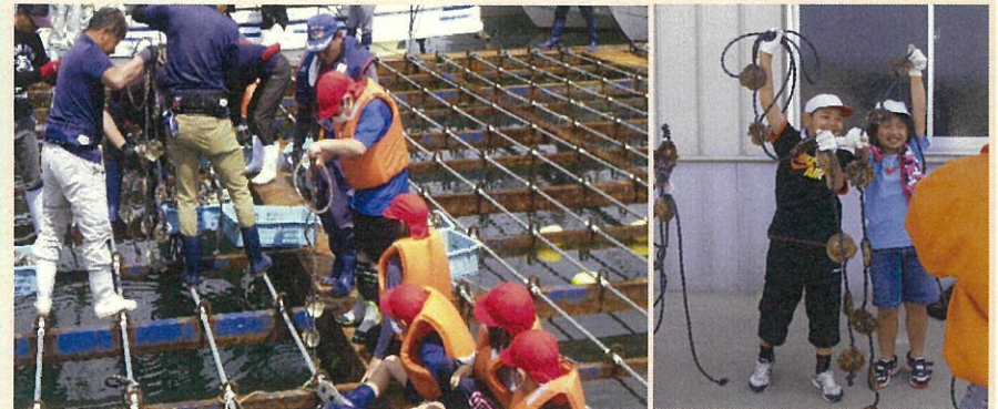
小学生によるカキ養殖体験学習の様子

・正組合員の高齢化が進んでおり、6年間で60歳以上の割合が10%上昇 ・高齢化対策として、漁協の青壮年部による小学生を対象としたカキ養殖体験学習及び新規就業希望者の支援を実施 → 体験学習経験者が地元に残り漁業に就業するほか、県・市の就業支援事業を活用し、4名が着業、2名が就業研修中。 →小学生を対象としたカキ養殖体験学習は、早い時期から漁業への理解醸成や魅力の体感を深め、 地域の漁業後継者確保・育成への波及効果も期待