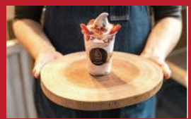
いちごショートのかりん

Cake & Cafe カキュー | 400円 | ■諫早市栄町1-15 ■電話番号:0957-24-2764