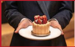
シャルロット・フレーズ

みのりカフェ長崎駅店 | 1,969円 | ■長崎市尾上町1-67(長崎街道かもめ市場1F) ■電話番号:095-893-8222