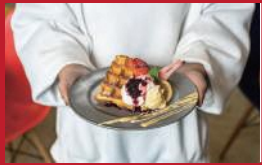
春いちごマッフル カスタードソースアイス添え

ラ・プリムール・ハマツ(ココウォーク内) | 950円 | ■長崎市茂里町1-55 2F ■電話番号:095-848-0009