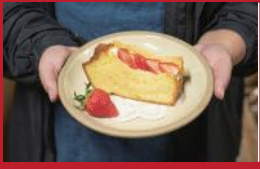
シフォンのいちごサンド

一葉団樂 | 400円 | ■諫早市幸町311-4 他 ■電話番号:0957-21-6500