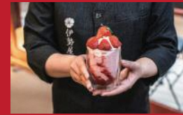
いちごヨーグルトフラッペ

小浜温泉ワイナリー | 1,540円 | ■雲仙市小浜町北本町862 ■電話番号:090-6964-5748