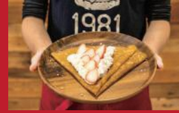
ランチーズのいちごクレープ

いぶき地 本店 | 630円 | ■諫早市八天町3-10 ■電話番号:0957-21-5050