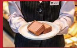
いちごカステラ巻

コーヒー&スイーツ「デイ・パート」(ヒルトン長崎内) | 850円 | ■長崎市尾上町4-2 ■電話番号:095-829-5488