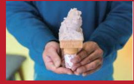
母さん牛の ジェラートいちご

和カフェ 和らびの | 680円 | ■諫早市目代町1485 ■電話番号:0957-47-6200