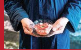
ミニオリジナルかんざし

イロドリココロ | 3,200円 | ■南島原市深江町丁4621-1 風びより内 ■電話番号:090-8804-1655