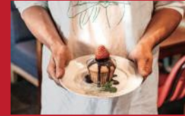
ハントーゴチソーライン

café mio | 500円 | ■島原市万町503-5 ■電話番号:0957-73-9030