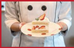
プレミアム生クリームと いちごのケーキ

古民家レストラン心笑 | 600円 ※要予約(2日前まで) | ■東彼杵郡川棚町上組郷1335 ■電話番号:0956-83-3456