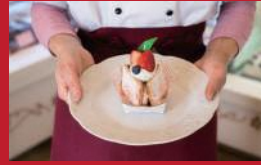
長崎いちごのカスタードパイ

Takagi | 1,300円 | ■島原市中町806 ■電話番号:0957-64-3301