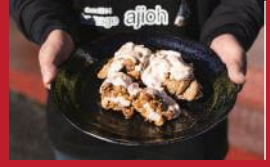
しょうゆからあげ イチゴソース添え

きりん食堂 | 880円 | ■諫早市八坂町7-17 ■電話番号:0957-22-4910