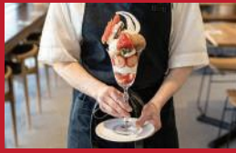
ゆめのかいちごパフェ

Bakery Shop Fleur | 1,900円 / 2,400円 ※単品購入可 | ■大村市森岡町663-3 サンスバおおむら施設内 ■電話番号:0957-40-0244