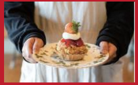
しあわせいちごのパイ

ベーグルまるこや | 480円 | ■大村市東大村1丁目2249-1 ■電話番号:0957-47-9553