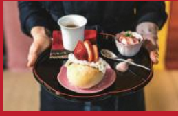
いちごあんバターサンド 食べたらいちご天福♡

創作厨房たこまる | 600円 | ■諫早市多良見町木床106のぞみ公園など市内3ヶ所 ■電話番号:0957-49-2731