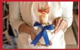
いちごの花束クレープ

陶農レストラン 清旬の郷 | 2,508円 | ■東彼杵郡波佐見町長野郷558-3 ■電話番号:0956-85-6288