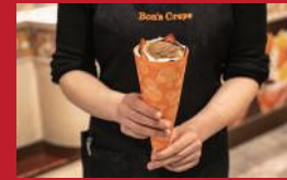
ストロベリーチョコ 生クリームアイスコーン

ハイドレンジャ(ホテルニュー長崎内) | 550円 | ■長崎市大黒町14-5-1F ■電話番号:095-828-7226