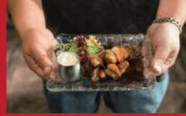
イチゴと鶏の洋風チキナン蛮

cafe topor store(カフェトポールストア) | 800円 | ■諫早市高城町 8-17 ■電話番号:050-1308-6489