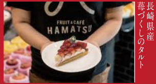
長崎県産 苺づくしのタルト

ボンズクレープ(ココウォーク内) | 740円 | ■長崎市茂里町1-55 3Fフードコート ■電話番号:0958-01-6101