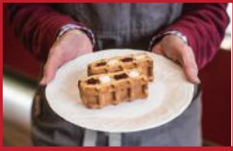
ボンパティのワッフル 雲仙いちご

ゴメンねエアポート | 540円 / 1カット※土日のみ(予約優先) | ■大村市協和町703-8 ■電話番号:0957-56-9546