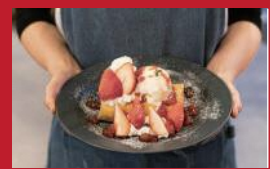
自家製ジャムのいちごシュー

橋屋本舗(お菓子のハシモトヤ パイビス店) | 480円 | ■諫早市鷺崎町308-5 ■電話番号:0957-21-3858