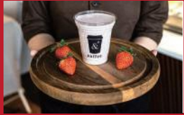
& Shake 苺

雲仙福田屋 | 宿泊者様の夕食デザートとして提供 | ■雲仙市小浜町雲仙380-2 ■電話番号:0957-73-2151