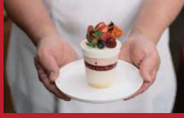
紅茶とイチゴのムース

からあげ味王 | 600円 / ソースは別添 | ■諫早市幸町37-3 ■電話番号:0957-21-0124