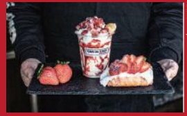
いちごやけしのストロベリー クローゼット

BonPatty | 162円 / 個 ※全店販売 | ■大村市幸町25 イオン大村施設内 他 全店 ■電話番号:0957-52-1789