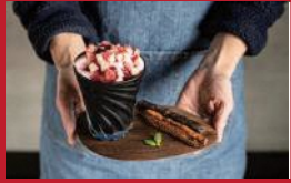
長崎県産さかのの チョコレートのがりがり

MARUZENカフェ | 1,100円 | ■島原市有明町大三東丙268-1 ■電話番号:0957-61-1535