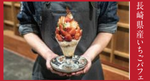
長崎県産いちごパフェ

みのりカフェ長崎駅店 | 1,969円 | ■長崎市尾上町1-67(長崎街道かもめ市場1F) ■電話番号:095-893-8222