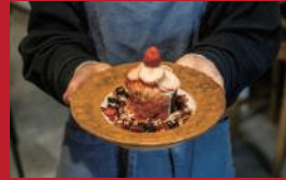
いちごのフォンダンショコラ 雲仙和紅茶付き

& coffee | 600円 | ■雲仙市千々石町丙2138-1 ■電話番号:0957-51-5000