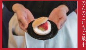
のんのいちご最中

つづみ団子 | 360円 | ■諫早市多良見町化屋789-25 ■電話番号:0957-43-0887