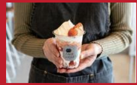
西海いちごのスムージー

かやのまる | テイクアウト 583円 / イートイン 594円 | ■東彼杵郡東彼杵町蔵本郷1754-1 ■電話番号:0957-46-3248