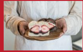
贅沢いちごサンド

カジュアルレストランOLIMAMA | 1,408円 | ■大村市東本町481 ミライ図書館1F ■電話番号:0957-46-3910