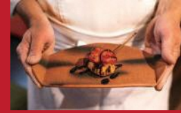
モックラテラチーズの串揚げ 苺とハムサミコーリス

ハンバーガー&クレープショップ トミーズ | 530円 | ■諫早市本町1-12 ■電話番号:0957-23-3843