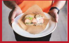
ハーブベーク いちごサンド

長崎ジャージーファーム | 450円 | ■諫早市長田町1147-3 ■電話番号:0957-24-8187