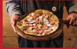
長崎県産さかのの 苺のピザ

Apartment. | 850円 | ■島原市中町806 ■電話番号:0957-64-3301