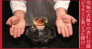
究極の手触りの杏仁豆腐 ジャズミン茶シロ掛け

海を見渡す個室露天の宿 伊勢屋 | 880円 | ■雲仙市小浜町北本町905 ■電話番号:0957-74-2121