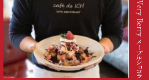
Very Berry マンマモン

集い居酒屋零~ZERO~ | 900円 | ■諫早市高城町7-17 ISMビル2F ■電話番号:0957-40-0199