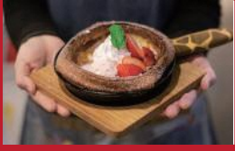
長崎いちごの ダッチペイビーケーキ

杉谷本舗 | 480円 | ■諫早市八坂町6-10 ■電話番号:0957-22-2306