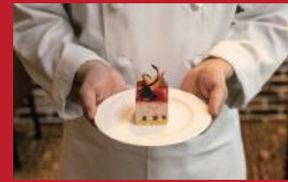
ムース・オ・フレーズ

バー「ムーンライト」(ホテルニュー長崎内) | 3,000円 ※ノンアルコールも可能 | ■長崎市大黒町14-5 ■電話番号:095-828-7319