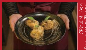
いちご餡とカスタードの カダイフ包み焼

中華ダイニング 杏てい | 650円 / 2個 | ■諫早市泉町25-32 ■電話番号:0957-21-8155