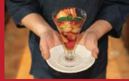
いちごしばじー かんざしー

酒×炬燵焼 三まいめ | 880円 | ■諫早市本町1-17 ■電話番号:0957-22-4393