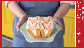
長崎県産 いちごのフルーツサンド

山茶花高原ピクニックパーク&ハーブ園 | 500円 / ベーグルはハーブカット | ■諫早市小長井町遠竹2867-7 ■電話番号:0957-34-4333