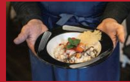
イチゴとシートのリゾット

おやつ屋シュークル | 550円 | ■西彼杵郡津津町左底郷88-5 ■電話番号:090-3016-1239