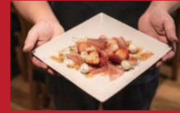
苺と生ハムのカブレゼ

洋菓子ル・ミエル | 630円 | ■諫早市城見町7-19 他 ■電話番号:0957-22-0088