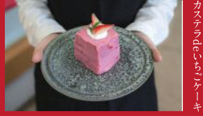
カステラのいちごケーキ

いさはや市場TETOTE | 480円 | ■諫早市栄町2-1 ■電話番号:0957-46-7585