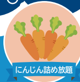
にんじん詰め放題