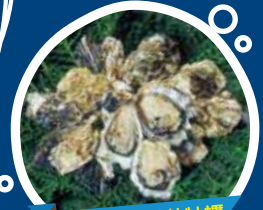
諫早湾:小長井牡蠣