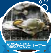
特設かき焼きコーナー