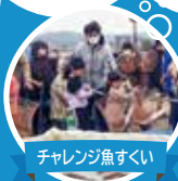
チャレンジ魚すくい