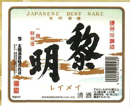
太陽酒造 黎明ラベル 杵の川蔵