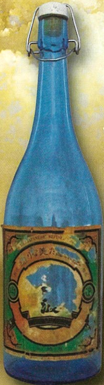
白波瓶(焼酎) 諫早市美術・歴史館蔵