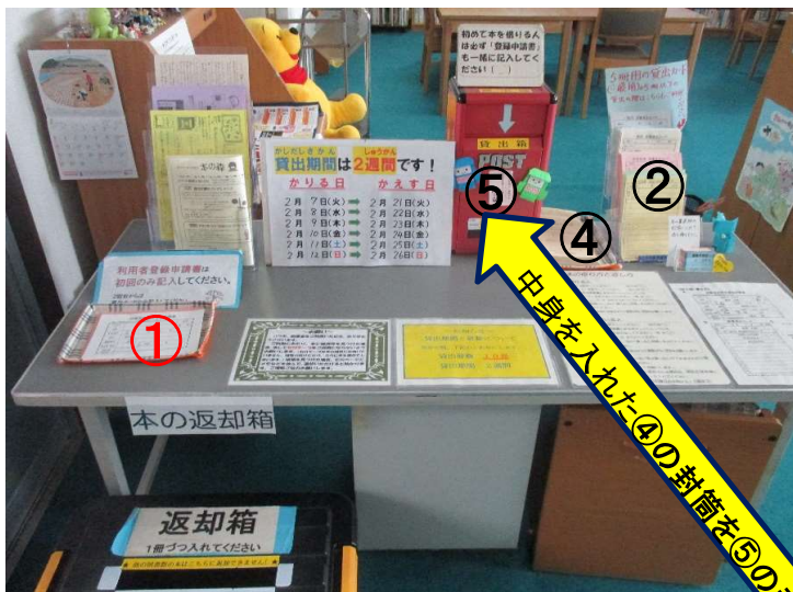
①登録申請書(初利用の方) ②図書貸出カード