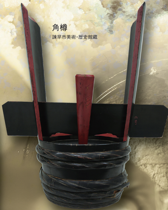
角樽 諫早市美術・歴史館蔵