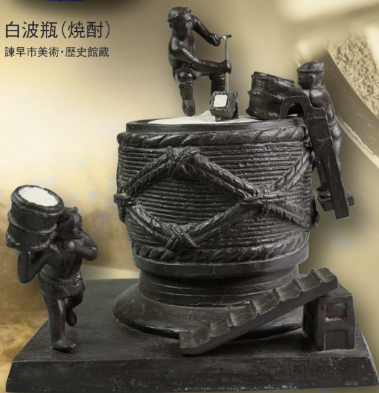
酒造り模型 米むし 長崎県酒造組合蔵