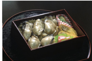
小長井ナビ 旅する牡蠣日和(弁当) ※イメージ(実物とは異なります)