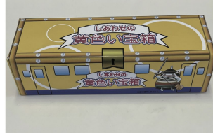
島原商業 しあわせの黄色い宝箱