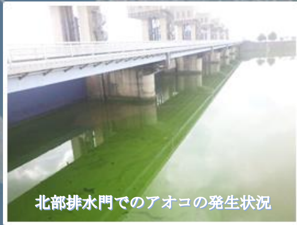
北部排水門でのアオコの発生状況

国営諫早湾干拓事業開門問題の早期終結及び環境改善、諫早湾を含む有明海の再生等の推進について