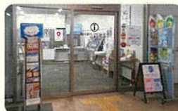
諫早駅観光案内PRコーナー