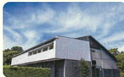
諫早市美術・歴史館