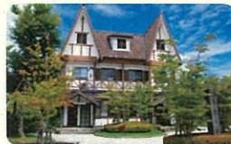
雲仙温泉観光案内所