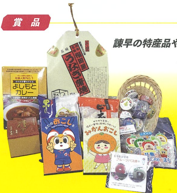
諫早の特産品やウルトラマングッズなど