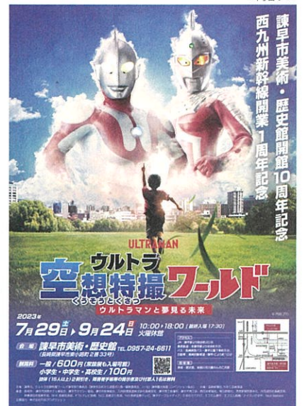
このクイズラリーは、諫早市美術・歴史館で開催の企画展『ウルトラ空想特撮ワールド～ウルトラマンと夢見る未来～』の関連企画です