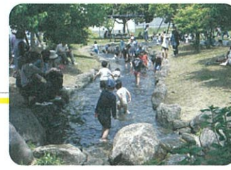
じゃぶじゃぶ水路