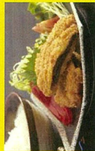
鯨専門店くらさき