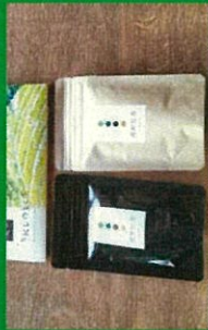
うれしの紅茶振興協議会