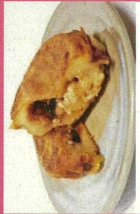
いなば焼のフアーマーズ