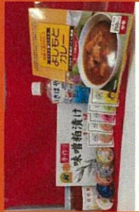
(一社) 諫早観光物産 コンベンション協会