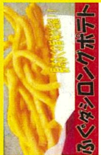
ふぐ問屋なかざき