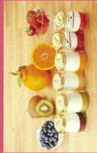
おおむら 夢フォームシユシュ