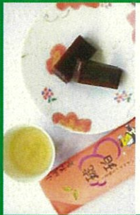
佐賀県立嬉野高等学校