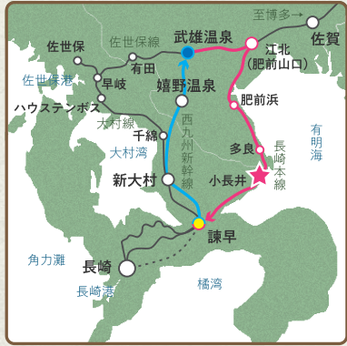
— 新幹線かもめ — ふたつ星4047