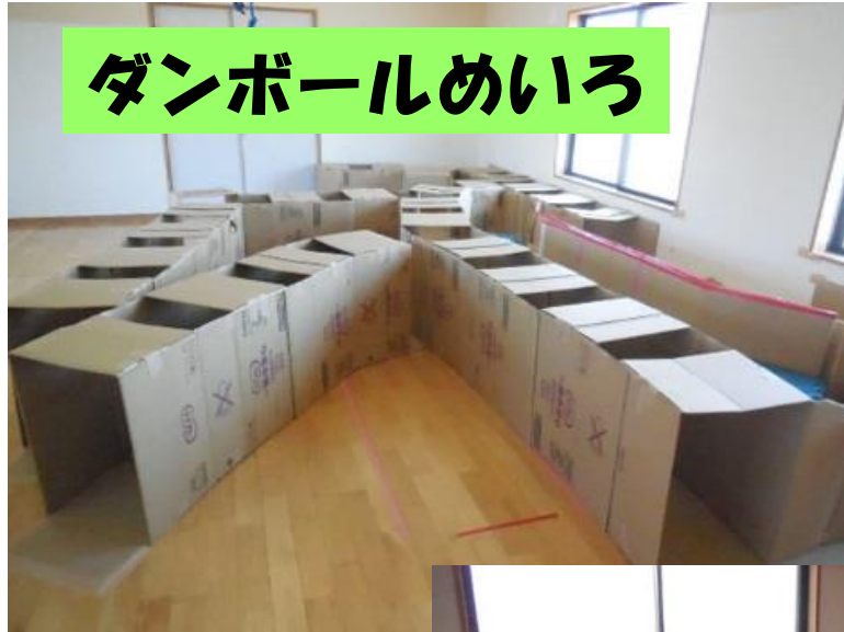
ダンボールめいろ