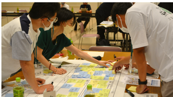
みんなでたくさんの意見を出し合いました

次に班で強み×機会のクロス分析(強みをいかして機会を勝ち取る方法は?)を話し合って具体的なアイデアをみんなで出していました。