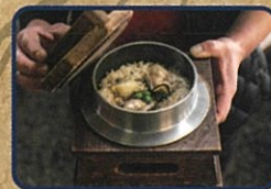
カキ釜めし お店情報はコチラ! 海鮮炭火焼処 幸田商店