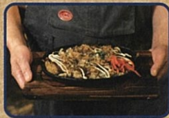
牡蠣のお好み焼き お店情報はコチラ! ぐりんど聖ちゃん