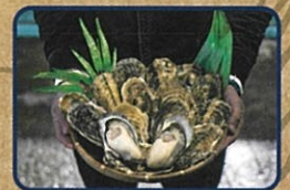
小長井かき焼き お店情報はコチラ! 諫早湾漁協小長井直売店

諫早市まちづくりサポート事業 | 後援/諫早市・(一社)諫早観光物産コンベンション協会 | 運営/頂プロジェクト実行委員会