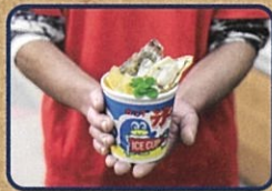
かき氷【華漣】 お店情報はコチラ! 竹野鮮魚