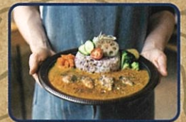
生クリーム仕立ての 小長井牡蠣カレー お店情報はコチラ! BASE Cafe