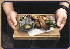
牡蠣のチーズ 春巻き お店情報はコチラ! 酒×炉端焼三まいめ