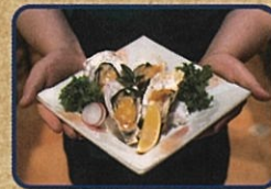
牡蠣の田楽焼き お店情報はコチラ! いぶき地