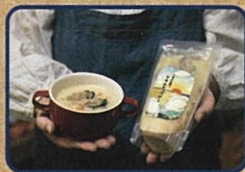
小長井牡蠣の クラムチャウダー お店情報はコチラ! フレッシュ251 2号店