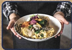
牡蠣 春菊・レモンパターの もちもち生パスタ お店情報はコチラ! 駅前ワインカフェbar-ba