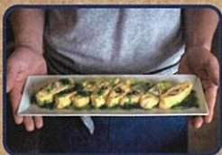
小長井牡蠣のだし巻き卵 ～生あさりの殻かけ～ お店情報はコチラ! しあわせ咲場