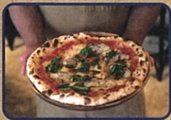
牡蠣と季節野菜 のピッツァ お店情報はコチラ! スプーンフルカフェ