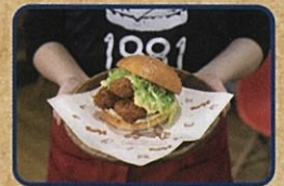
小長井牡蠣 バーガー お店情報はコチラ! トミース