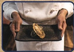
牡蠣の殻付き揚げ ディアブル お店情報はコチラ! 香串揚げ やぶから坊