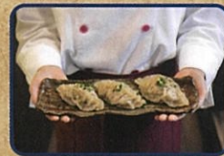
丸ごと牡蠣入り ジュージー餃子 お店情報はコチラ! 中華ダイニング 蒼てい