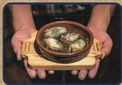
小長井牡蠣の アヒージョ お店情報はコチラ! PENNY-LANE